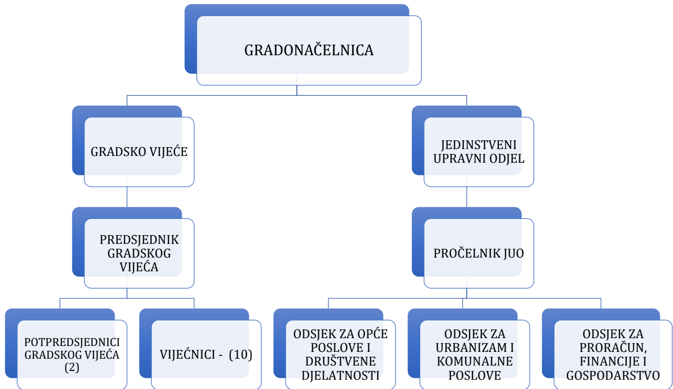
Slika 1. Organizacijska struktura Grada Ozlja

Organizacijska struktura Grada Ozlja oblikovana je s ciljem učinkovitog provođenja javnih politika, transparentnog upravljanja i pravodobne usluge građanima. Strukturno je podijeljena u sljedeće sastavne dijelove koji se nalaze u Organizacijskoj strukturi Grada Ozlja slika 1.