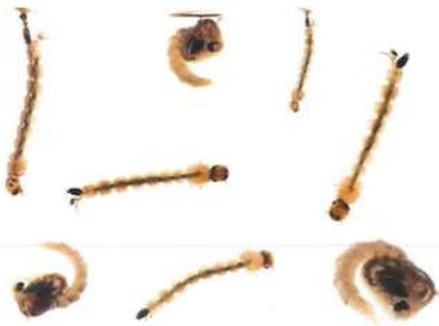
Kukuljice i ličinke komarca

NAJBOLJI NAČIN SMANJENJA BROJA KOMARACA JE UKLONITI OSNOVNI UVJET ZA NJIHOV RAZVOJ: STAJAĆU VODU.