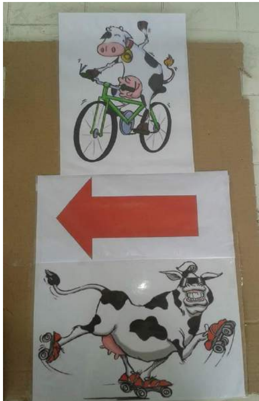
Biciklijada 2016. DND

Savjet mladih od početka sadašnjeg sastava surađuje sa Društvom Naša Djeca. Dana 15. svibnja 2016. godine održana je dječja Biciklijada 2016. Članovi Savjeta mladih pratili su kolonu malenih biciklista, a grad Ozalj pružio je financijsku potporu.