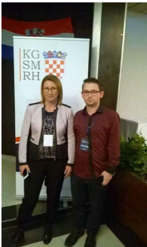
Član Savjeta mladih sa Europarlamentarkom Ivanom Maletić