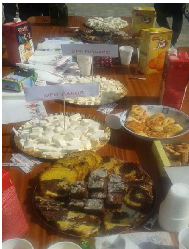
Obiteljsko poljoprivredno gospodarstvo Puškarić.