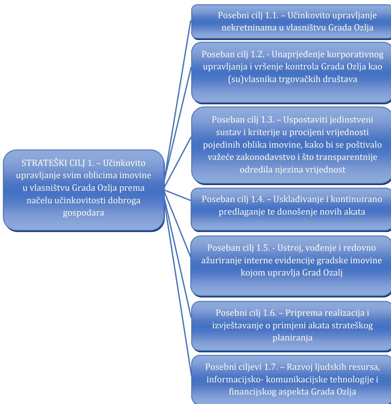
Slika 2. Kaskadiranje strateškog cilja upravljanja gradskom imovinom