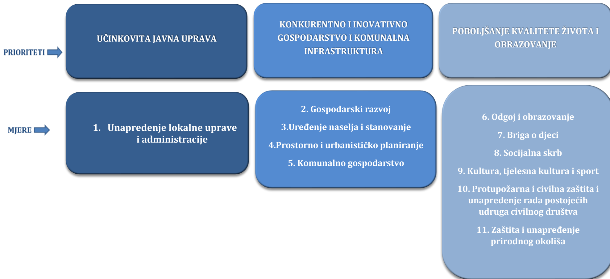
Slika 2. Pregled temeljnih strateških prioriteta i mjera